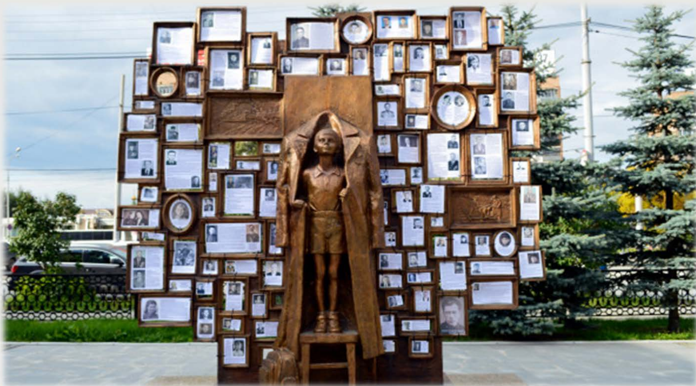
ПАМЯТНИК «С ЧЕГО НАЧИНАЕТСЯ РОДИНА»