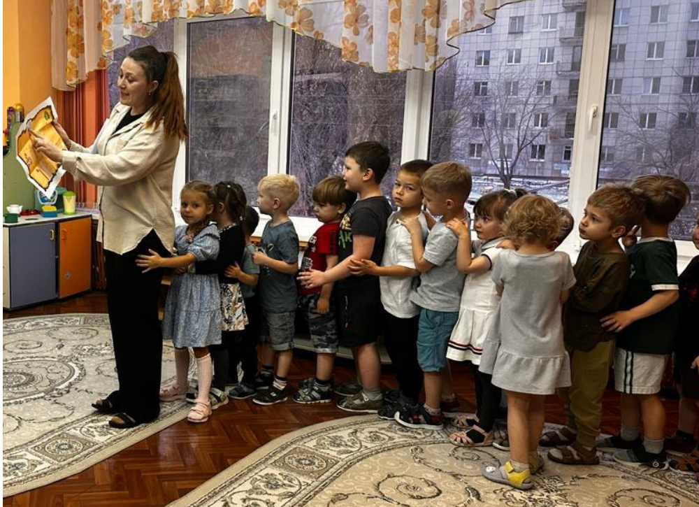
Сюжетно-ролевая игра «Экскурсия по городу»