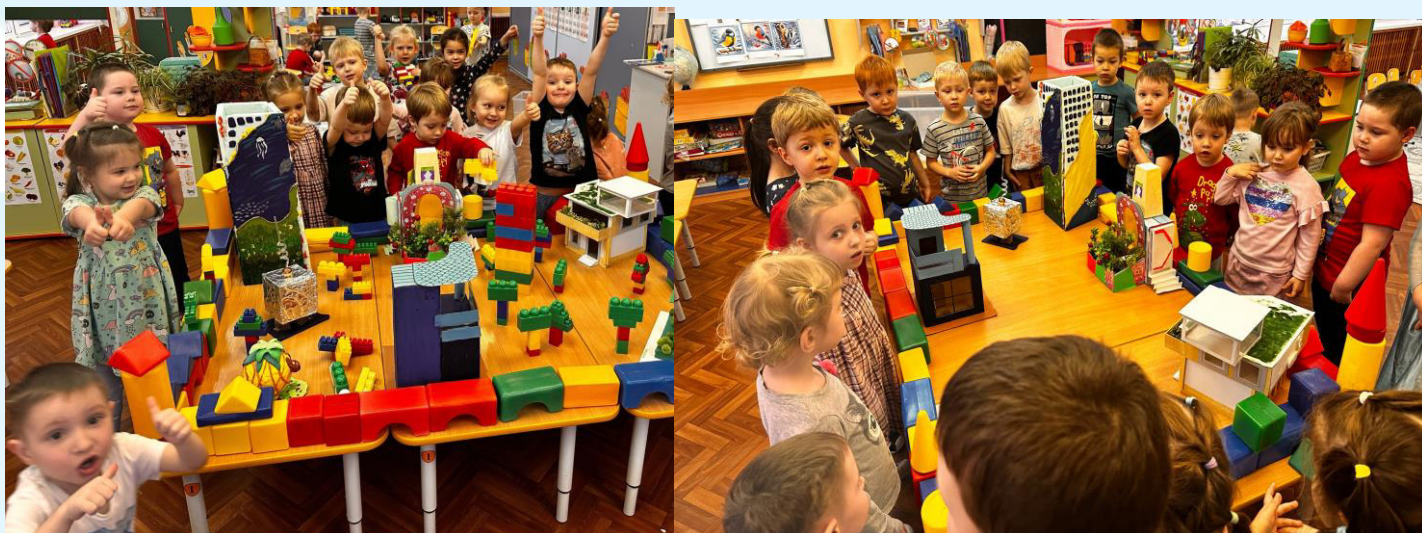
Создание коллективного макета «Город будущего»