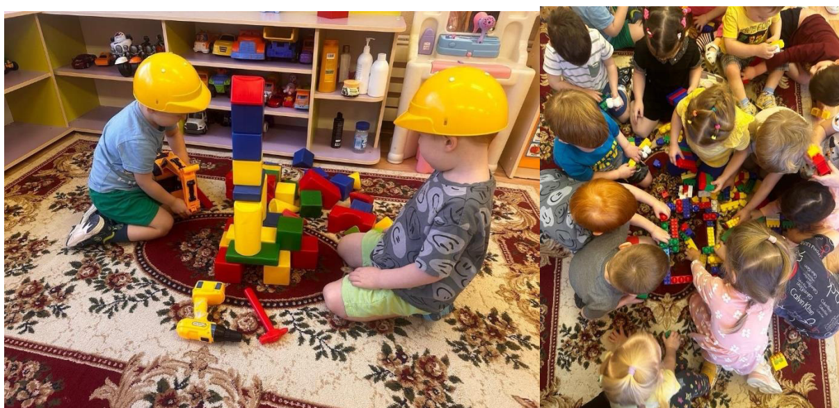
Сюжетно-ролевая игра «Строитель»