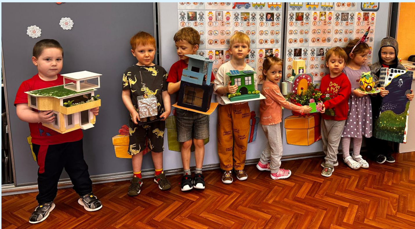
Выставка макетов «Дом моей мечты»